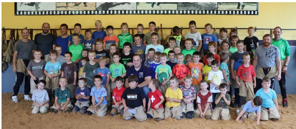
Gesamtfoto mit Überraschungsgast Schwingerkönig Joel Wicki

Zum Schluss gab es für alle Wurst mit Brot und ein kleines Präsent als Andenken an diesen Schnuppertag.